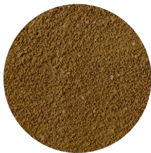
Alcon Club Health Carnívoros

Sob recomendação profissional, a proporção alimento/água apresentada no Passo 2, pode ser ajustada para cada caso.