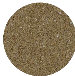
Alcon Club Health Aves

Para definir a quantidade a partir da necessidade calórica do animal, considerar que uma colher de sopa cheia do alimento seco contém aproximadamente 15 gramas.