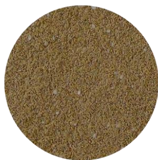
Alcon Club Health Herbívoros